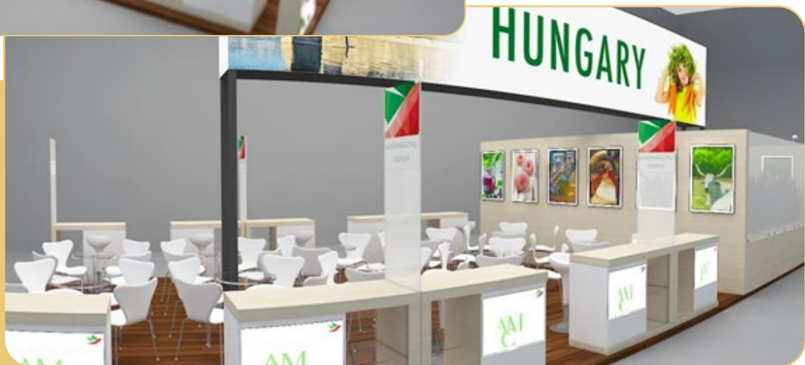
A kép illusztráció.